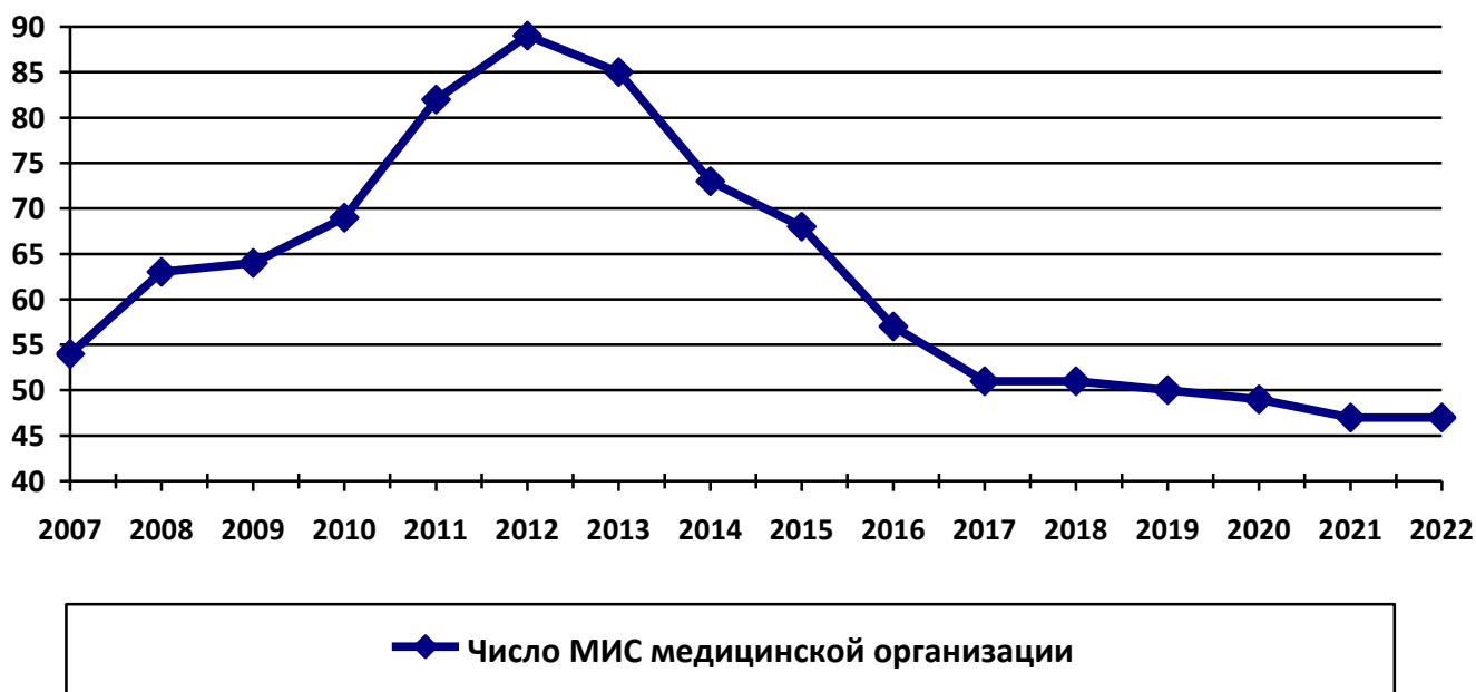
Рис. 1. Динамика числа различных типов МИС медицинской организации